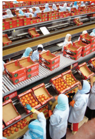
Station d'emballage de fruits et légumes près d'Agadir, Maroc

Les thèmes du Congrès veulent mettre l'accent sur l'horticulture et l'amélioration des conditions de vie en Afrique. Le format de ce Congrès va permettre sur plusieurs thématiques d'attirer un grand nombre de conférenciers de qualité et des contributions qui seront présentées en sessions parallèles, pas forcément toutes scientifiques. L'objectif est de rapprocher tous les acteurs de la filière horticole, de faciliter les interactions chercheur-consommateur-producteur afin de mieux intégrer la recherche et de créer un véritable forum des communautés horticoles en Afrique pour l'échange d'idées, d'expériences et de visions d'avenir partagées.