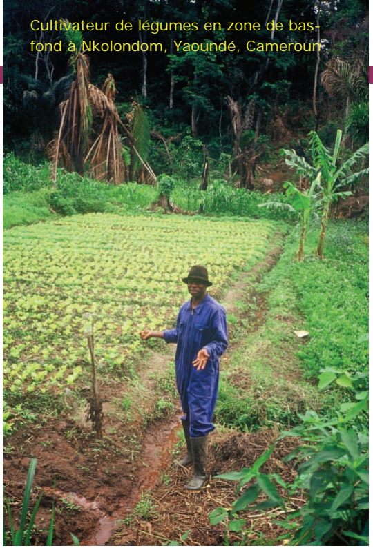
Cultivateur de légumes en zone de bas-fond à Nkolondom, Yaoundé, Cameroun